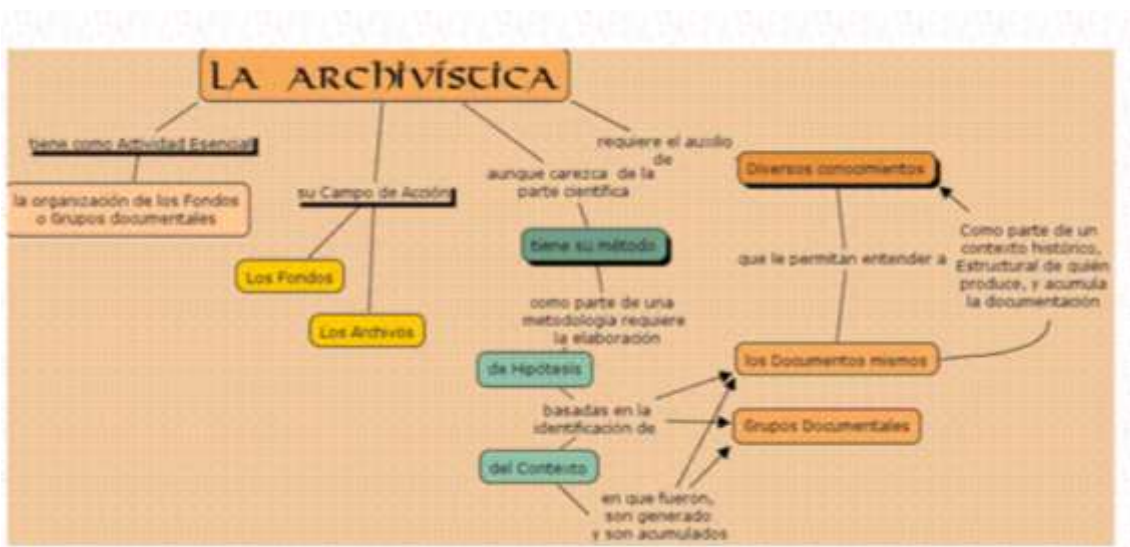
Figura 1. La archivística

Este amplio campo específico de la Archivística tiene que contar con la ayuda de otras ciencias que, como auxiliares, son indispensables para el completo desarrollo de aquélla: la Diplomática, la Paleografía, la Cronología, la Sigilografía, la Historia General, y sobre todo institucional, y el Derecho Administrativo, con relaciones y diferencias establecidas. Y también precisa para su desenvolvimiento con los conocimientos de otros profesionales relacionados con la Arquitectura, Restauración, Reproducción, Química, Biología e Informática.