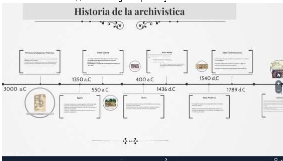
Figura 2. Evolución histórica de la archivística

La archivística es la ciencia de los archivos. Como tal, se ocupa de la creación, organización y servicio de los mismos. Lo que distingue esencialmente a la archivística de otras disciplinas afines, es su visión globalizadora, pues considera a los documentos como un conjunto estructurado, procedente de una institución. De tal suerte que podemos definirla como la ciencia que estudia la naturaleza de los archivos, los principios de su conservación y organización, así como los medios para su utilización. La archivística científica se sostiene sobre principios estables y normas más o menos generalizadas. La teorización lleva alrededor de 150 años en algunos países y menos en el nuestro.