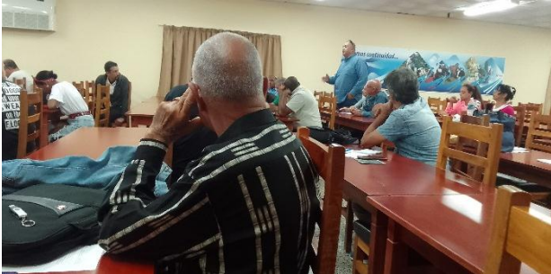
Fructífero encuentro de la Dirección de Desarrollo de Boyeros con los Actores Económicos de los Consejos Populares Wajay, Altahabana-Capdevila y Armada.

El papel y contribución de VALUARTE desde nuestros servicios para el logro de esos objetivos de trabajo conjunto, en función de conducir, aportar, viabilizar, potenciar, gestionar el desarrollo del municipio, fue parte de lo expuesto en nuestras intervenciones en esos encuentros.