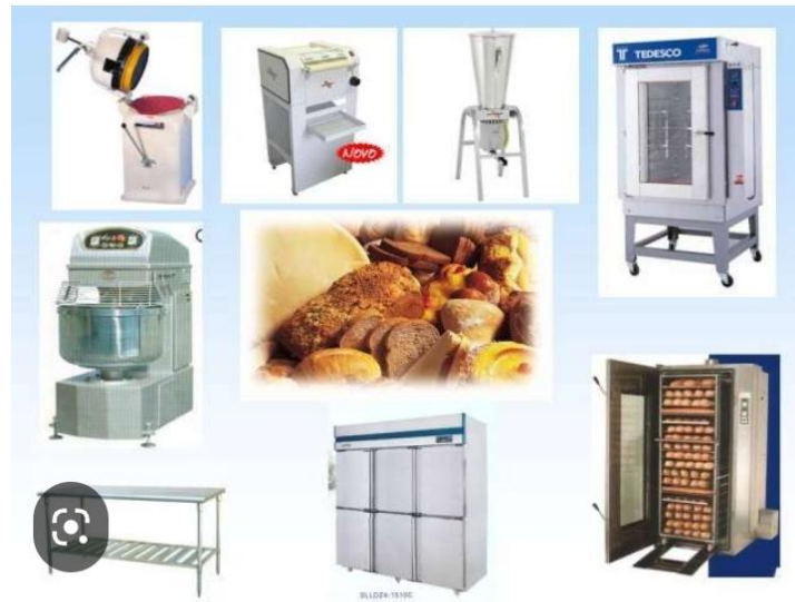
Algunos de los equipos necesarios para la industria de pan y dulce

El equipamiento necesario para ambos procesos consiste fundamentalmente en: amasadora, batidora, máquina seccionadora de masa, maquinas moldeadoras o conformadoras, equipos de fermentación, hornos, mesas de trabajo, estantes porta bandejas, balanzas y variados utensilios de cocina entre otros.