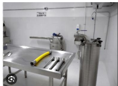
Mesa y utensilios