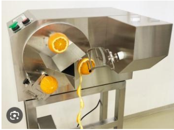
Peladora de Fruta