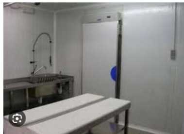
Mesa y fregadero

El punto de preparación para la venta estará equipado con mesas de trabajo de acero inoxidable, fregadero, refrigerador, nevera de exhibición, pesas, envasadoras y selladoras, y otros utensilios para cortar y limpiar la carne y el pescado que se comercialice.