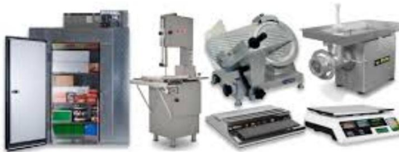
Nevera Sierra, Lasqueadora, Moledora Envasadora-Selladora, Pesa

El producto terminado sería pesado, envasado y sellado para ser comercializado.