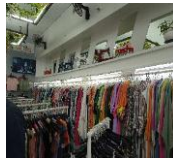
Punto de pago de la mercancía