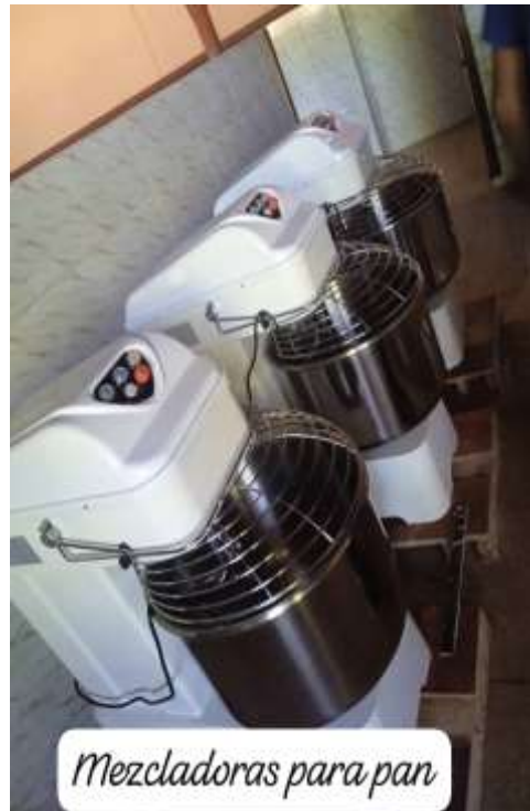
Mezcladoras para pan