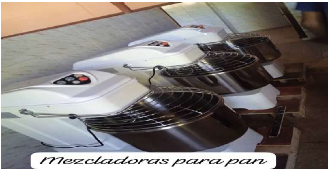
Mezcladoras para pan