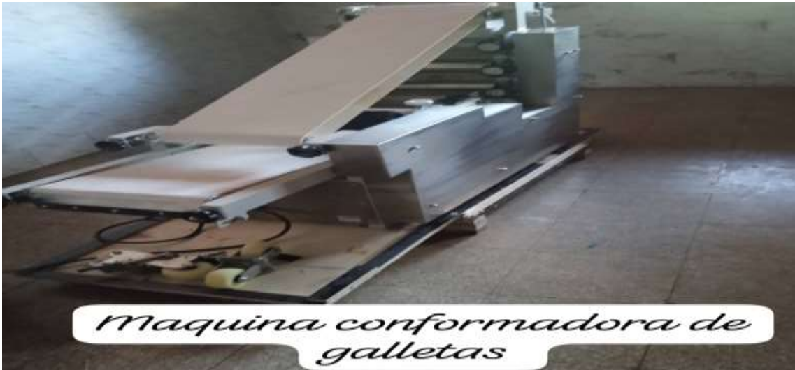
Maquina conformadora de galletas